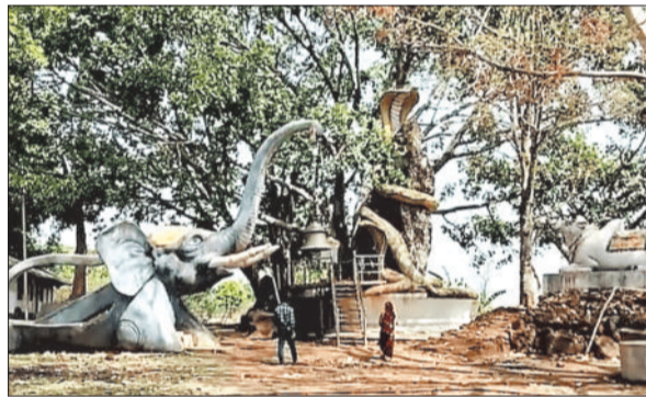
पारदर्शी व्यवस्था के लिए नई समिति गठन की मांग

श्रद्धालुओं का कहना है कि वर्तमान में मंदिर संचालन के लिए कोई संगठित सार्वजनिक ट्रस्ट या विधिवत समिति सक्रिय नहीं है, जिसके कारण अव्यवस्था बनी हुई है। समाज ने प्रशासन से मांग की है कि शीघ्र एक नया सार्वजनिक ट्रस्ट गठित किया जाए, ताकि मंदिर का संचालन पारदर्शी और व्यवस्थित ढंग से किया जा सके।