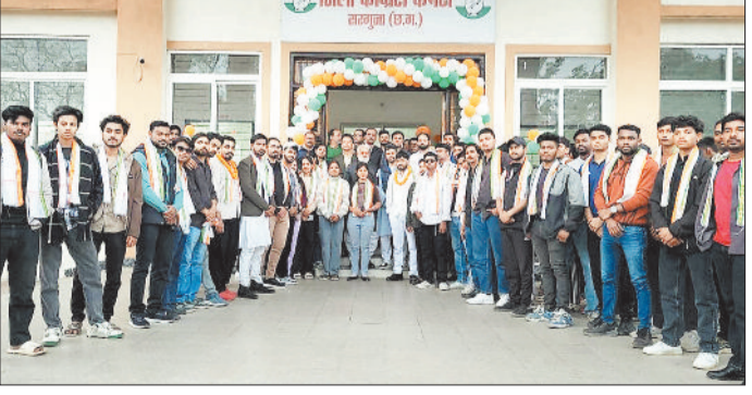
कांग्रेस पदाधिकारियों के साथ नवप्रवेशित कार्यकर्ता।