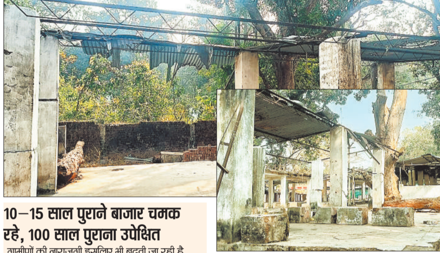
10-15 साल पुराने बाजार चमक रहे, 100 साल पुराना उपेक्षित

नारायणपुर का यह साप्ताहिक बाजार केवल व्यापार का स्थान नहीं, बल्कि आसपास के दर्जनों गांवों की आर्थिक जीवनरेखा रहा है। यहां दूर-दराज के ग्रामीण अपनी उपज और जरूरत का सामान खरीदने-बेचने आते थे। लेकिन आज यहीं बाजार टूट शोड, उखड़े फर्श और अव्यवस्थित ढांचे के कारण अपनी पहचान खोता जा रहा है।