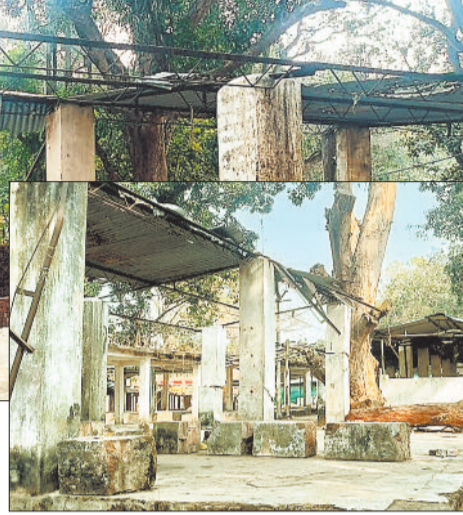
ग्रामीणों का आरोप - स्वार्थ के लिए राजनीति, विकास से दूरी

ग्रामीणों की नाराजगी इसलिए भी बढ़ती जा रही है क्योंकि नारायणपुर से कुछ ही दूरी पर स्थित बनकोबा, हराडोड और कलीबा जैसे क्षेत्रों में साप्ताहिक बाजारों की शुरुआत महज 10-15 वर्ष पूर्व हुई है। इन स्थानों पर जनप्रतिनिधियों की सक्रियता और विकास के प्रति गंभीरता के चलते आकर्षक और आधुनिक शेडों का निर्माण हो चुका है, जिससे बाजारों की सुंदरता और सुविधा दोनों बढ़ी हैं। वहीं दूसरी ओर, 100 वर्षों से लग रहा नारायणपुर का ऐतिहासिक बाजार आज भी बुनियादी सुविधाओं के लिए तरस रहा है।